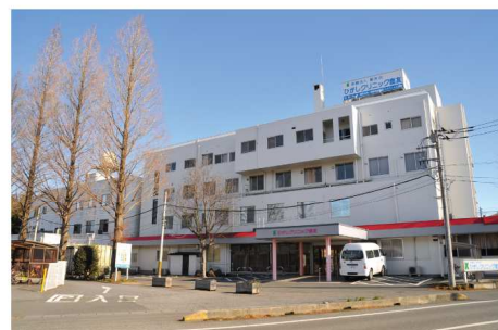
■ひがしクリニック慶友 〒302-0108 茨城県守谷市松並 1630-1 TEL:0297-48-6001 FAX:0297-45-3450