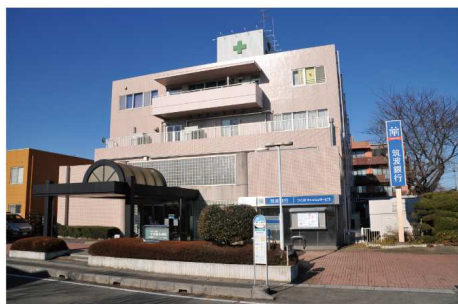
■守谷慶友病院 〒302-0118 茨城県守谷市立沢 980-1 TEL:0297-45-3311 FAX:0297-45-4541