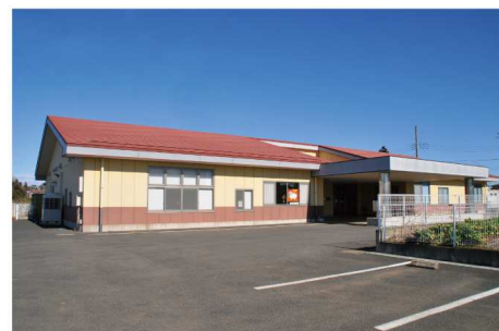
■伊奈クリニック 〒300-2307 茨城県つくばみらい市板橋 2243-1 TEL:0297-20-7755 FAX:0297-58-5507