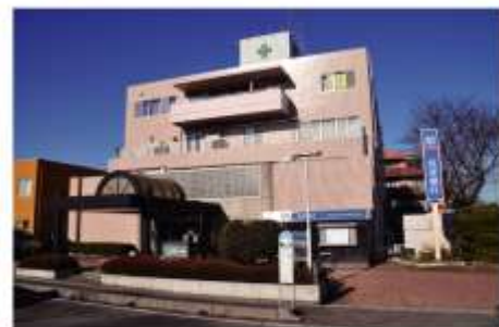
■守谷慶友病院 〒302-0118 茨城県守谷市立沢 980-1 TEL:0297-45-3311 FAX:0297-45-4541