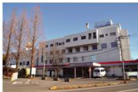
■ひがしクリニック慶友 〒302-0108 茨城県守谷市松並 1630-1 TEL:0297-48-6001 FAX:0297-45-3450