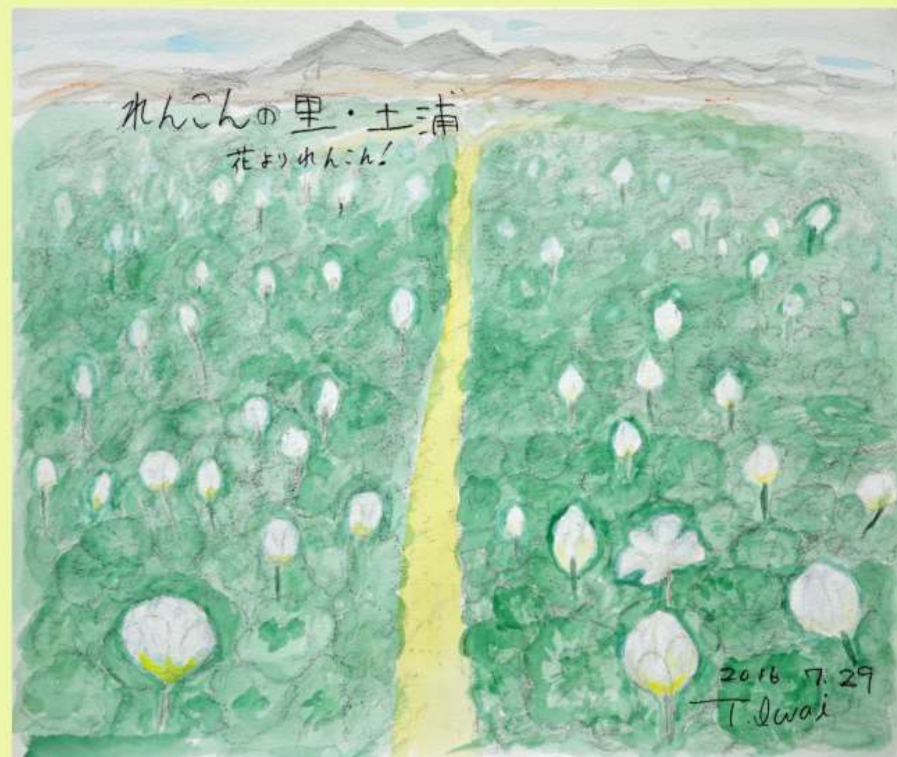
れんこんの里 土浦